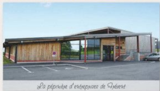
La pépinière d'entreprises de Frevent

C'est possible ! la communauté de communes de frévent le fait !